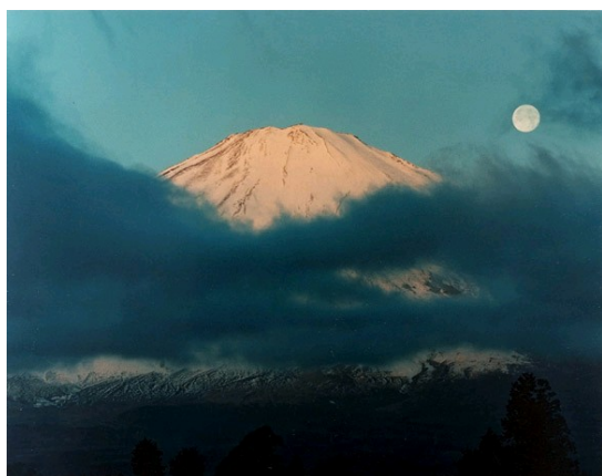
「満月の朝とグリーン空・雲」